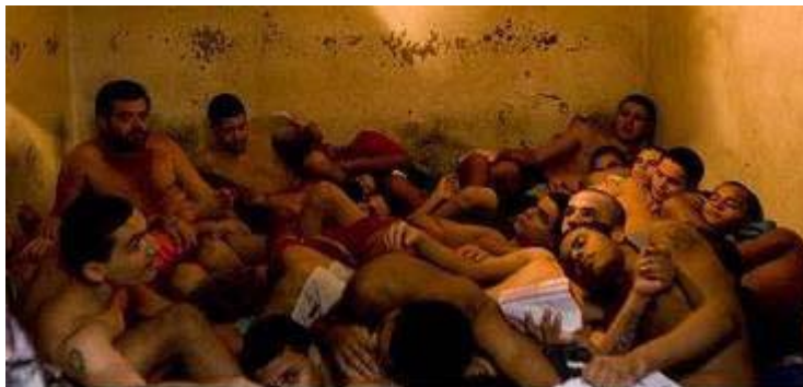
Carceragem de Contagem, em fevereiro de 2008

O fato foi noticiado na imprensa, provocando a ira do governador Aécio Neves, que mandou a Procuradoria do Estado requerer a revogação da ordem. Incontinenti, o Tribunal de Justiça de Minas Gerais acatou o pedido. Mas, quando a ordem revogatória chegou, os presos já estavam livres